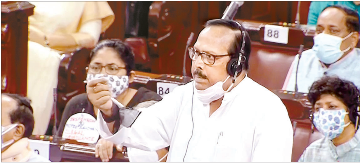
রাজ্যসভায় বজ্রাঘাতের সূক্ষ্মদৃশ্যের রায়। বৃহস্পতিবার।

পাশে আদর অক্সফোর্ড-আস্ট্রেলিয়ার জেনারেল ভ্যাকসিনই কোভিডশিল্ড নামে ভারতের বাজারে ছেড়েছে সিরাম। কিন্তু ইওরোপের কয়েকটি দেশ এ-এখনও ছাড়পত্র পায়নি। এই পরিষ্টিভে কোভিডশিল্ড নিয়ে ওই সব দেশে গলে ভারতীয় পছন্দীদের থাকতে হচ্ছে কোয়ারেন্টিনে। তাঁদের পাশে দাঁড়ানো সিরাম অধিকর্তা আদর পুনঃপাঠাল। কোয়ারেন্টিনে থাকা পছন্দীদের জন্য ১০ কোটি টাকার তহবিল গড়লেন তিনি। এটি খাতে কেয়ার্নকে দিতে হবে ১২০ কোটি ডলার।